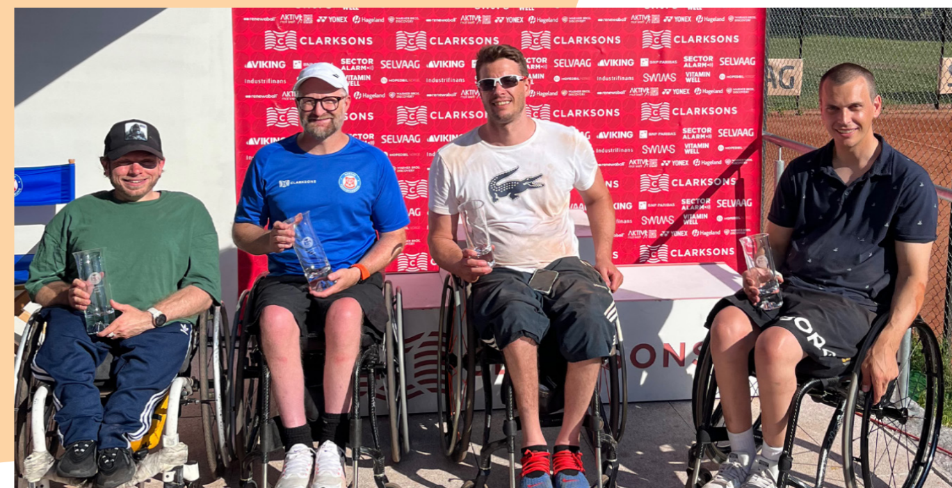
NM i rullestoltennis 2023