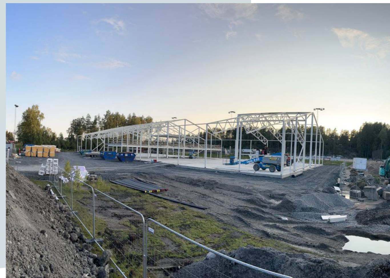
Kolbotns 4 baners innendørshall står klar i mars 2024