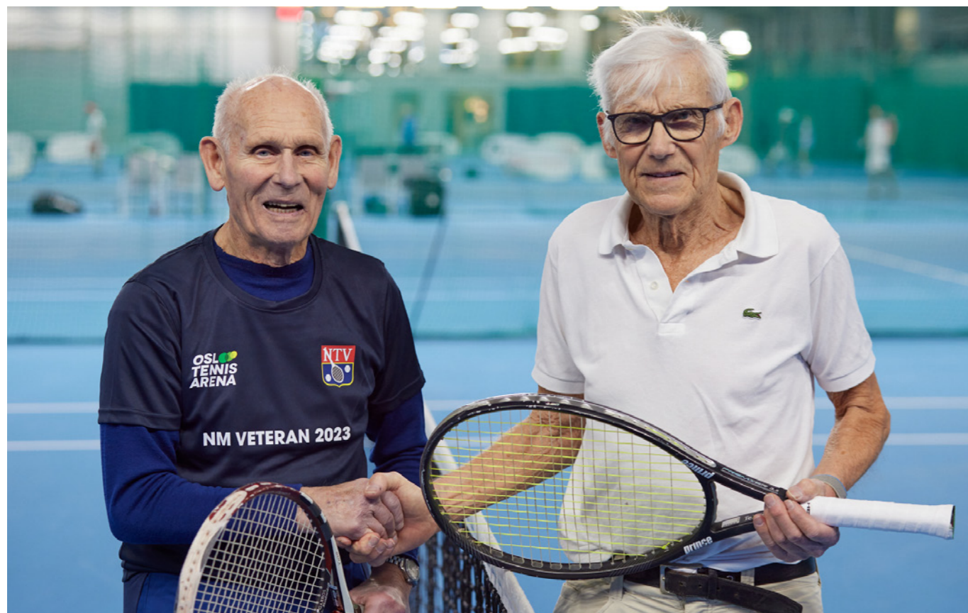
NM i Veteran, +90 finalistene.