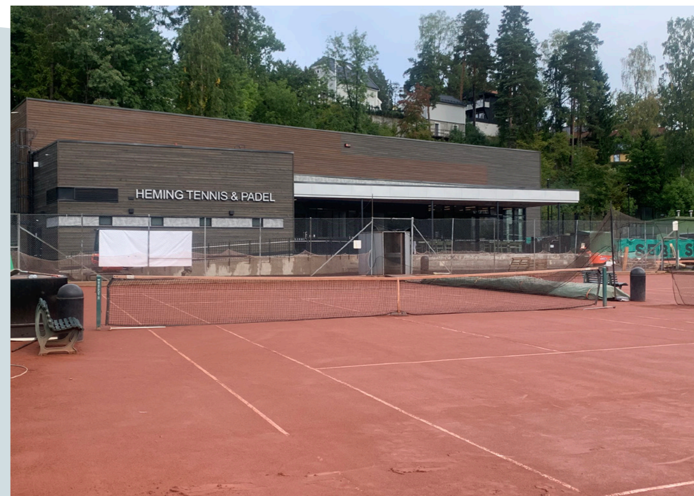
Hemings nye klubbhus og padelanlegg