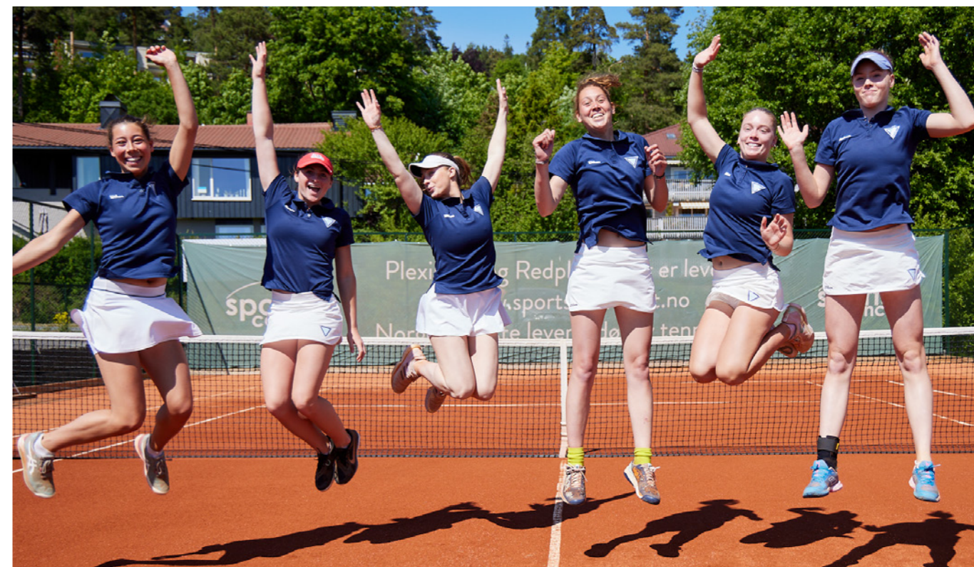
Holmenkollens elitelag for damer